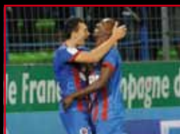
La Ligue 2 Le match à suivre #04