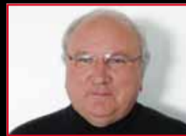
La tribune Alain Le Floch #06

La Butte Restaurant Hôtel & Spa Traiteur gastronomique Séminaire